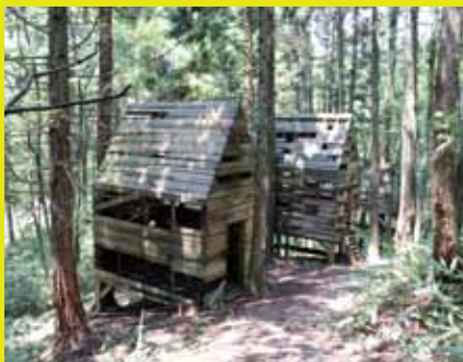
graf〈3つの小屋〉 2006年/アートキュメント'06作品